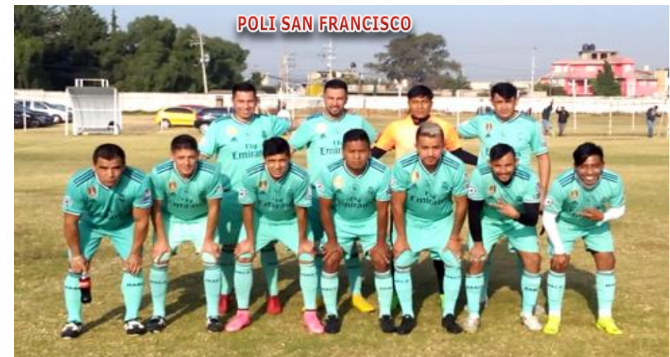
POLI SAN FRANCISCO