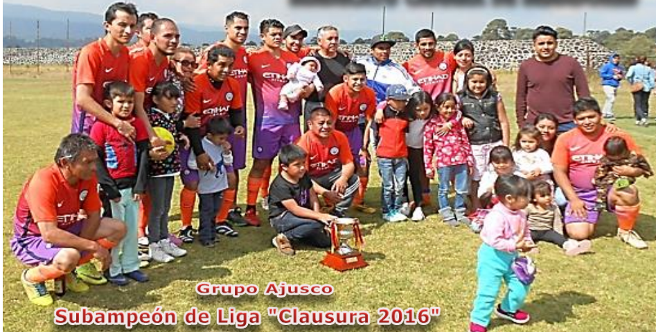
Grupo Ajusco Subampeón de Liga "Clausura 2016"