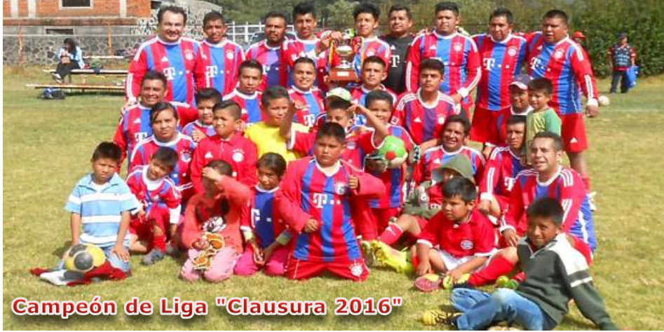
Campeón de Liga "Clausura 2016"