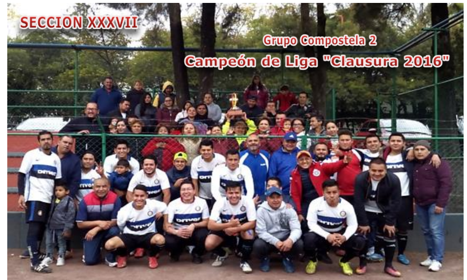
Grupo Compostela 2 Campeón de Liga "Clausura 2016"