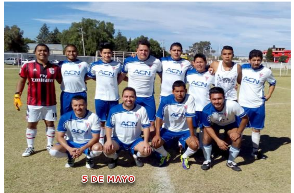
5 DE MAYO