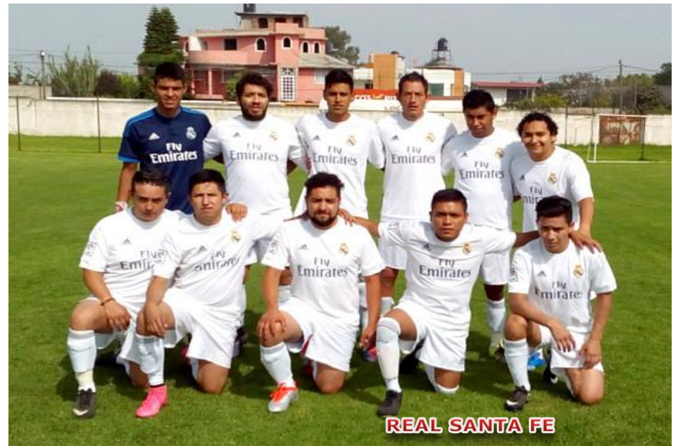
REAL SANTA FE